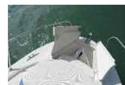
Une baille à mouillage conséquente. Deep anchor locker. Un pozo de ancla importante.