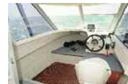
Porte trois vantaux. Three parts sliding door. Puerta corredora tres partes.

Diseñado para la pesca costera, el OCQUETEAU 605 procura una bañera amplia, importantes cofres y una timonería espaciosa. Rápido, estable, este barco se adapta a todos los tipos de salidas.